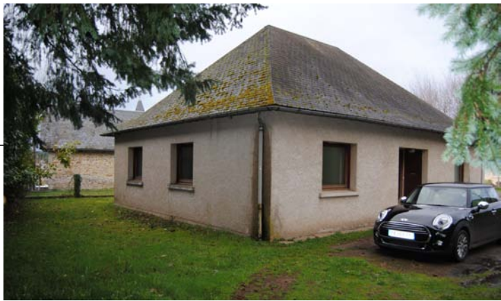
Vue Sud Ouest