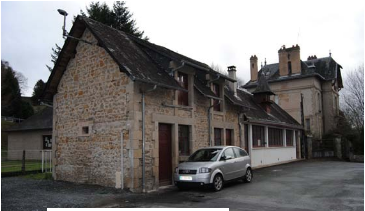
Vue Nord - Est