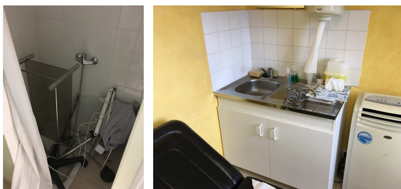
Equipements sanitaires à déposer

Les installations déposées seront soit remis au maître d'ouvrage, soit évacués à la déchetterie selon la réglementation en vigueur.