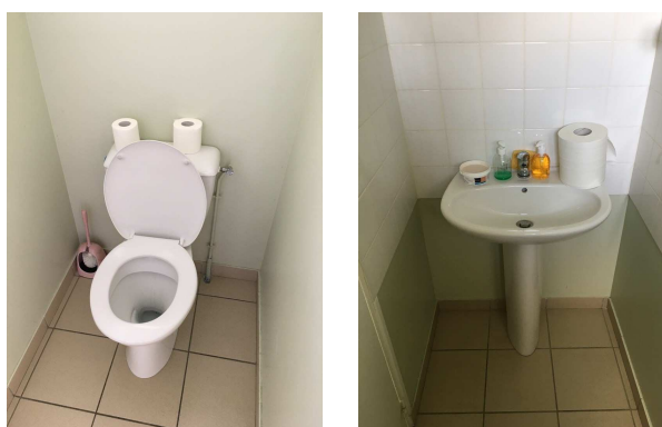
Equipements sanitaires conservés

Les équipements sanitaires du WC studio seront conservés.